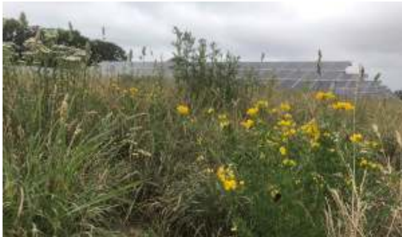
Abbildung 5: Artenvielfalt im Solarpark

Die Umsetzung des festgesetzten Planungskonzeptes wird sich erkennbar positiv auf Natur und Artenvielfalt auswirken. Durch die Extensivierung der Flächen und den Verzicht auf Pflanzenschutz- und Düngemittel kann sich der Boden langfristig von der intensiven landwirtschaftlichen Nutzung erholen und die Bodenfruchtbarkeit sowie die Wasserqualität gesteigert werden. Für viele Pflanzen- und Tierarten wird nachhaltig neuer Lebensraum geschaffen.