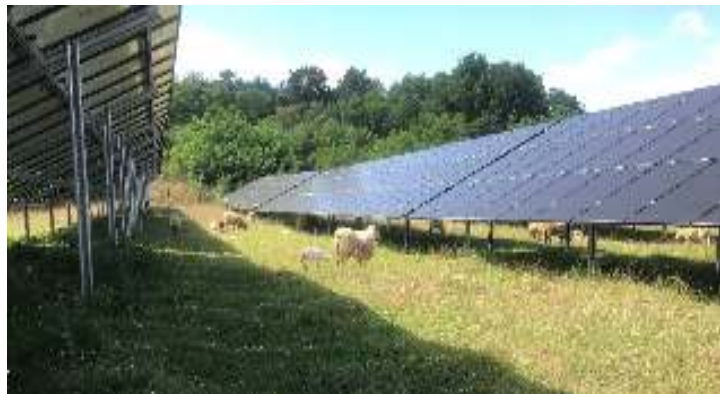
Abbildung 6: Extensive Schafbeweidung im Solarpark

Die geplante Beweidung der Anlage mit Schafen stellt eine effektive und gleichzeitig naturnahe Pflegemöglichkeit dar, um z. B. eine Verschattung der Module zu vermeiden. Der Schäfer kann die eingezäunte Fläche nutzen und Einnahmen durch die Pflegeleistung erzielen. Die Schafe finden unter den Modulen Schutz vor der Witterung. Durch ihre Tritte schaffen sie bereichsweise offene Stellen, wodurch kleinräumige Strukturen entstehen, welche besonders von konkurrenzschwachen und damit seltenen Tieren und Pflanzen besiedelt werden.