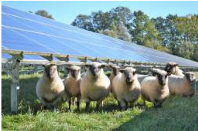
Abbildung 1: Schafbeweidung im Solarpark

Die Pflege der Solarparkflächen soll vorzugsweise durch Schafbeweidung erfolgen. Neben der Nutzung zur Energiegewinnung findet damit auch die Landwirtschaft auf der Fläche Berücksichtigung.