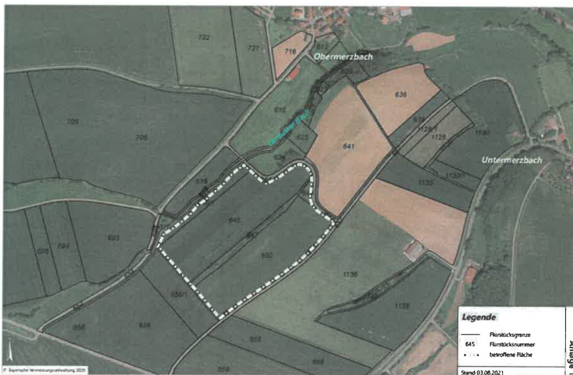
Lageplan des Änderungsbereiches

Der Änderungsbereich hat eine Größe von ca. 9,7 ha und liegt westlich von Untermerzbach und südlich von Obermerzbach. Er umfasst die Flurstücke 645/1, 645, 647, 649, 650 und 651 der Gemarkung Obermerzbach. Die Lage und der Flächenumfang sind dem beigefügten Lageplan zu entnehmen.