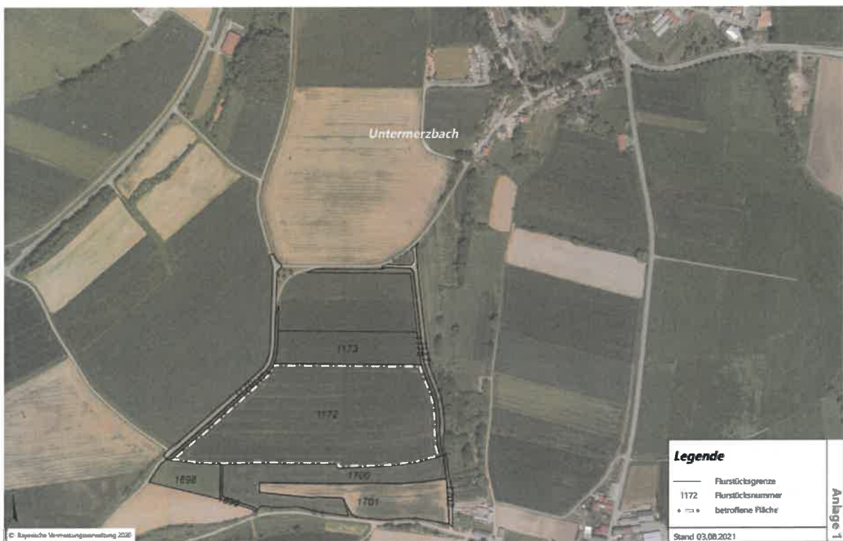
Lageplan des Plangebietes

Das Plangebiet hat eine Größe von ca. 6,1 ha und liegt nordwestlich von Recheldorf und südwestlich von Untermerzbach im Landkreis Haßberge. Es umfasst das Flurstück 1172 der Gemarkung Untermerzbach. Die Lage und der Flächenumgriff sind dem nachfolgenden Lageplan zu entnehmen.